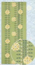
竜胆の花本版更紗 間名古屋帯 人間国宝 鈴木滋人 242,000円