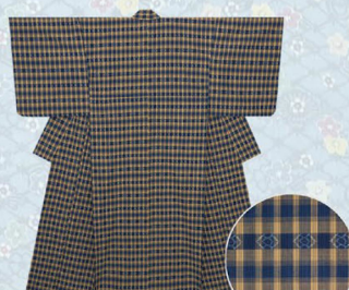
「ビーマ重雲格子」琉球美緋木綿着物 日本工芸会正会員 真栄城喜久江 286,000円