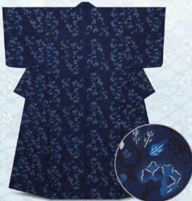
「斜め波に牡丹づくし文様」本場琉球藍型染小紋着物 日本工芸会正会員 滝間栄順 462,000円