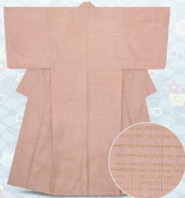
「かすみ」織地に糸余訪問着 向井淑子 286,000円