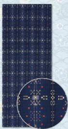
「籠の薔薇」 本綿花織名古屋帯 日本工芸会正会員 鳥巣水子 473,000円