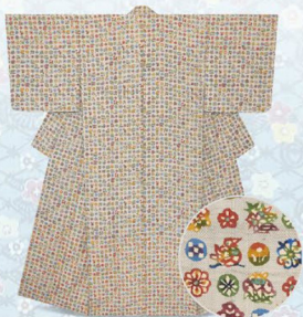
「銀色の楽園」型絵染小紋着物(生地・松尾鏡子) 国画会会員 小島貞二 891,000円

季節を彩る友禪や型絵染の美しさ、楽しさ、手仕事の積み重ねて創られた工芸的な作品の魅力あふれる佇まい いつまでも愛され続けるような、素晴らしい作品の数々を是非ご覧ください